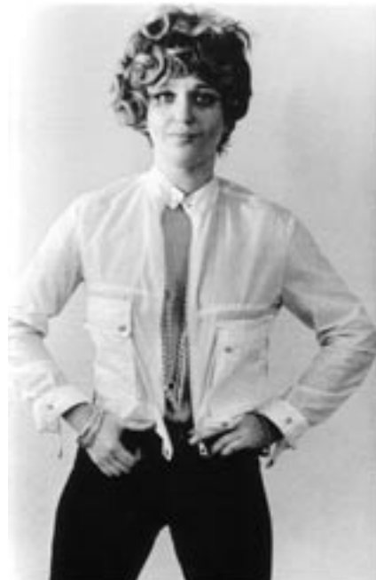
VALIE EXPORT alias VALIE EXPORT