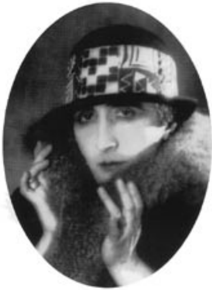
Rose Selavie alias Marcel Duchamp