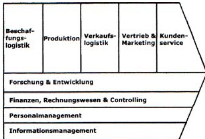
Schaubild 1: Porters Wertschöpfungskette im Original bei der Unternehmung

Michael E. Porter bildete 1985 die Aktivitäten einer Unternehmung als Teile einer Wertschöpfungskette ab. Aus den Inputfaktoren werden durch die Transformation innerhalb der Unternehmung die Outputfaktoren bzw. Endprodukte. Als Aktivitäten der Unternehmung lassen sich dabei primäre Aktivitäten (Beschaffungslogistik, Produktion, Verkaufslogistik, Vertrieb und Marketing sowie Kundenservice) und sekundäre Aktivitäten (Forschung und Entwicklung, Finanzen, Rechnungswesen und Controlling, Personal- und Informationsmanagement) unterscheiden. Porters Wertschöpfungskette ist exemplarisch in Schaubild 1 abgebildet.